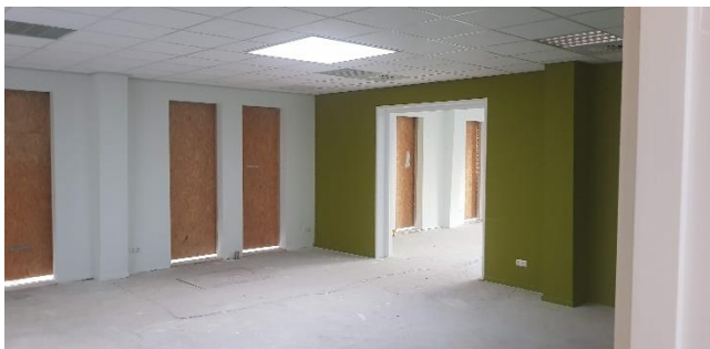
lokaal groep 7