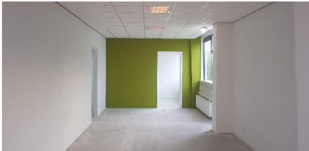
leerplein gr 7/8 en werkruimte 1